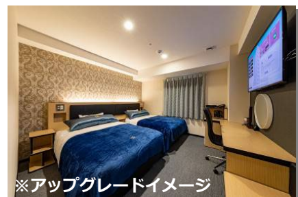
※アップグレードイメージ